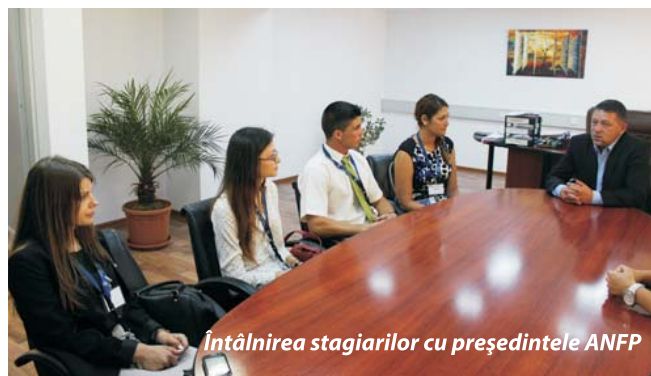
Întâlnirea stagiarelor cu președintele ANFP

Percepția mea despre funcționarii publici înainte de a veni în ANFP era una greșită deoarece era formată prin prisma informațiilor venite din mass-media. În primul rând, mediul de lucru nu este unul îmbătrânit, gata să se pensioneze, sunt foarte mulți tineri competenți care lucrează aici. O altă paradigmă care a fost schimbată a fost aceea a concursurilor de recrutare în administrația publică. Părerea generală a oamenilor „din afara sistemului” este că posturile din administrația publică sunt date pe principiul nepotismului. Situația nu stă deloc așa, angajații ANFP participă la organizarea concursurilor de recrutare sau